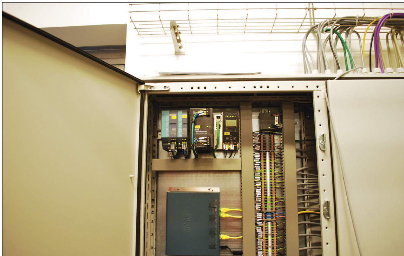
Et kig ind i styretavlen, hvor AS-i Gateway modtager signaler fra Airboxene via det gule AS-i kabel. Gatewayen behandler data, konverterer dem til ProfiNet og sender dem videre til vandværkets SCADA-system.