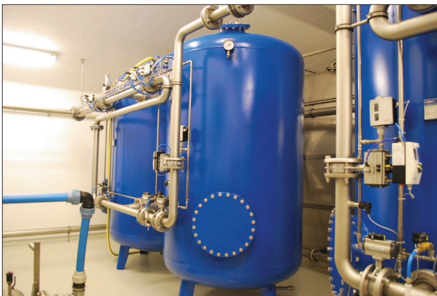
Det ene »sæt« filtre på vandværket. De to filtreringsbeholdere filtrerer råvandet fra grundboringerne til rent drikkevand til de tilknyttede 504 husstande. Vandværket har to identiske renselinjer.

-Reelt har vi kigget til mejerisekto- ren og har adopteret deres tankme- toder, for det giver jo reelt ingen men- ing, at vandet ikke har samme op-