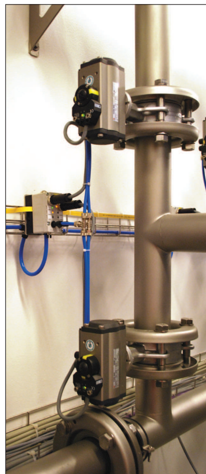
Hver af de tre grundvandspumper er også bestykket med ventiler og styringer fra Bihl+Wiedemann.