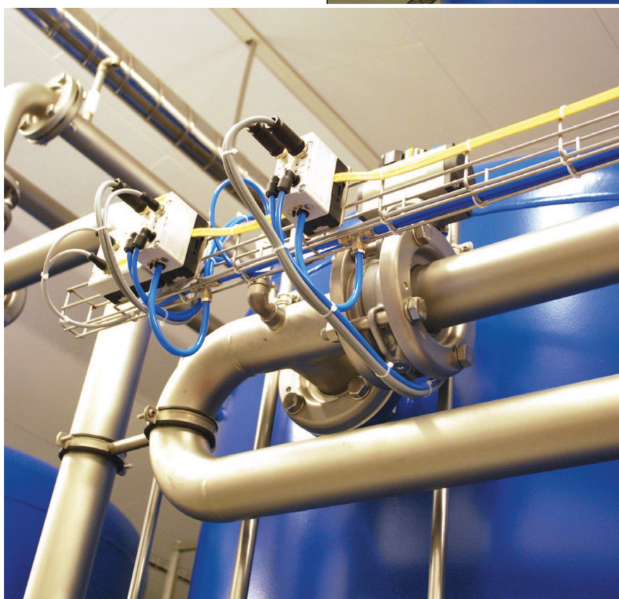
Et nærmere kig på Airboxene.